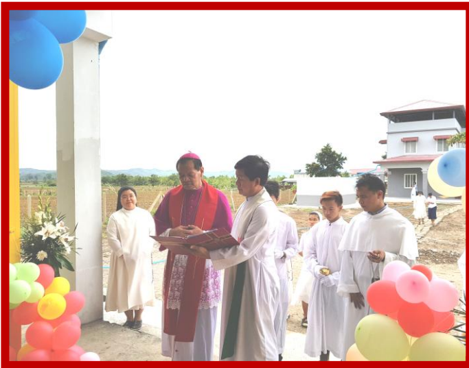
BENDICIÓN del parvulario.