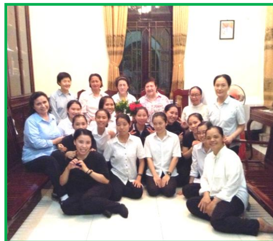
Comunidad de Vietnam

Por vuestra disponibilidad, prontitud, delicadeza, atenciones... ¡Gracias!