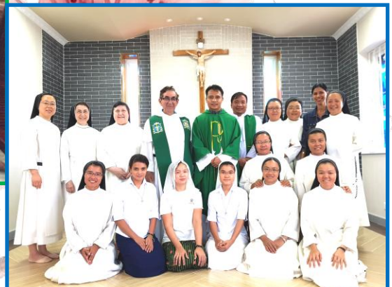
Comunidad de Myanmar

Por vuestra disponibilidad, prontitud, delicadeza, atenciones... ¡Gracias!