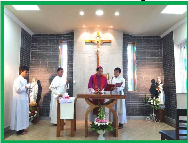
Consagración del altar de la nueva capilla.