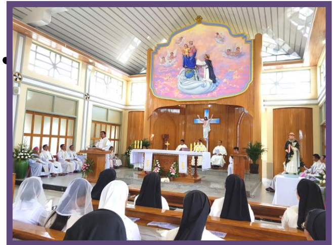
La asamblea numerosa canta alabanzas al Señor.