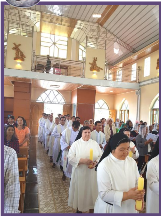
Procesión de ingreso a la iglesia.