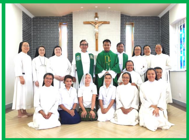
Primera Misa en la capilla de la nueva casa.

Detrás de esta hermosa y bien preparada celebración de la doble bendición, de la casa y del parvulario, hubo mucho trabajo, dedicación y cariño en hacer las cosas. 'Horas extras' para el Señor y el bien común.