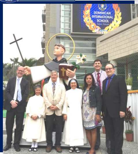
Los 4 Acreditadores de WASC

Enhorabuena a la Comunidad religiosa y educativa de Dominican International School , Taipei, por la 'Acreditación' recibida por el período de un sexenio.