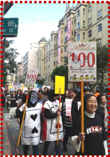
Caminata, regreso al Colegio y almuerzo con las alumnas