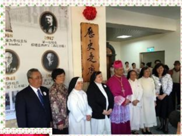
Conmemoración del centenario