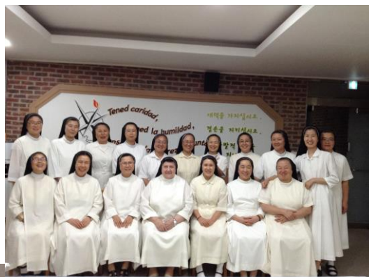
Hoengseong: Casa Noviciado y Parroquia