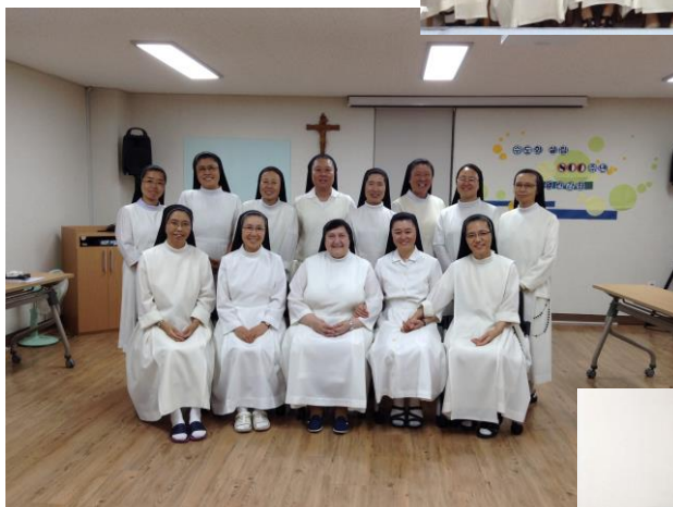
Seúl: Casa Juniorado